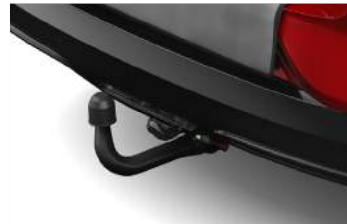
HAK HOŁOWNICZY - ODŁĄCZANY (2 483 493)