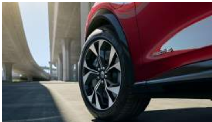
OSŁONY NADKOLI LAKIEROWANE W KOLORZE CZARNYM Standard dla wersji PREMIUM