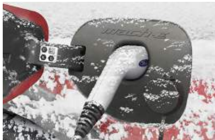
OSŁONA PORTU ŁADOWANIA (2 630 165)