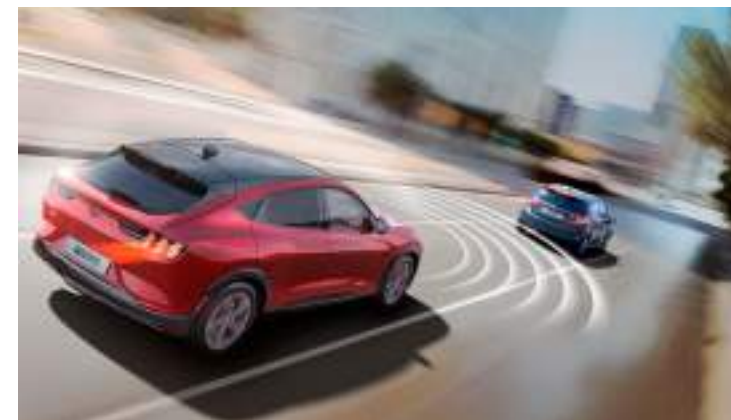
TEMPOMAT ADAPTACYJNY - z funkcją utrzymania pojazdu na środku pasa ruchu oraz z systemem STOP&GO Standard dla wszystkich wersji