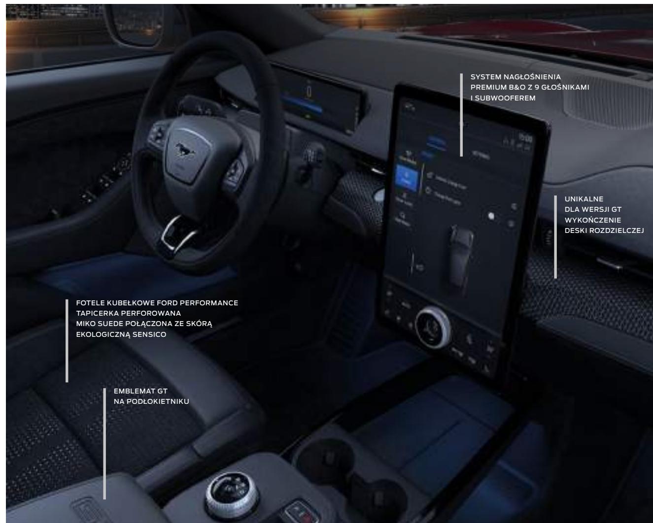
FORD MUSTANG MACH-E | GT