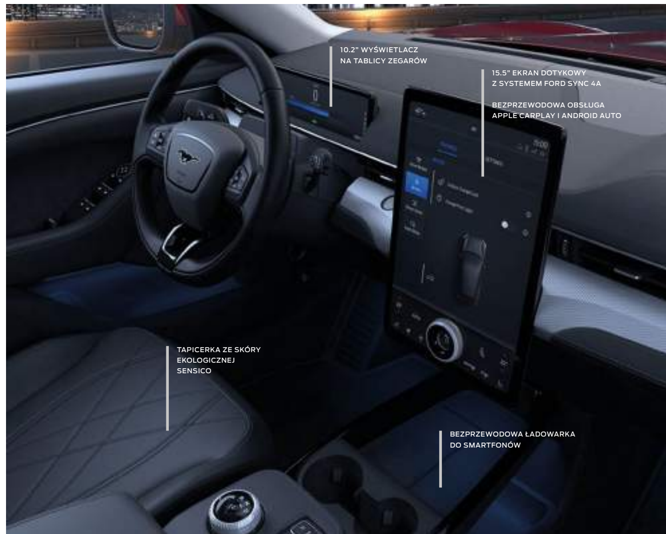
FORD MUSTANG MACH-E | MACH-E