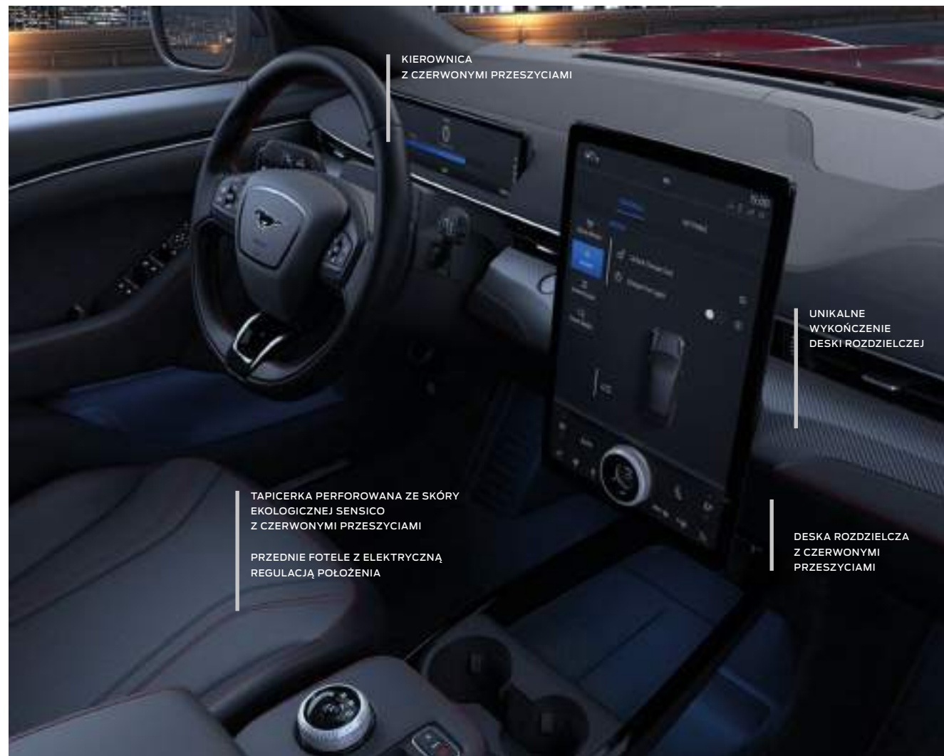
KIEROWNICA Z CZERWONYMI PRZESZYCIAMI