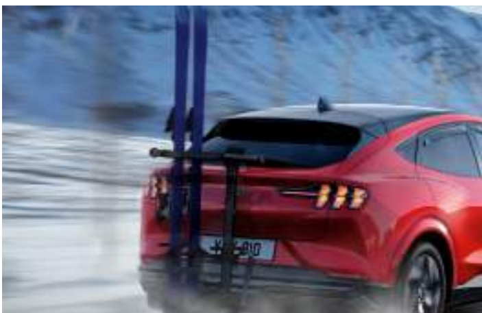
UCHWYT NA NARTY MONTOWANY DO HAKA HOŁOWNICZEGO (2 483 279)