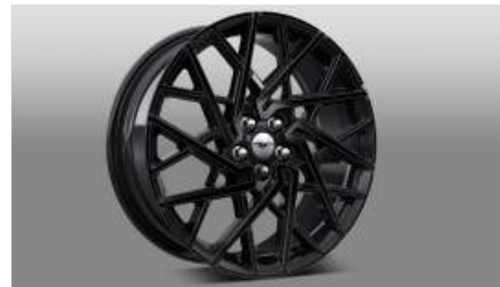
20" OBRĘCZE KÓŁ ZE STOPÓW LEKKICH, OGUMIENIE 245/45 GT | 2 200 zł