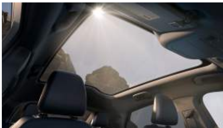
DACH PANORAMICZNY Standard dla wersji GT Opcja dla wersji Mach-E i PREMIUM