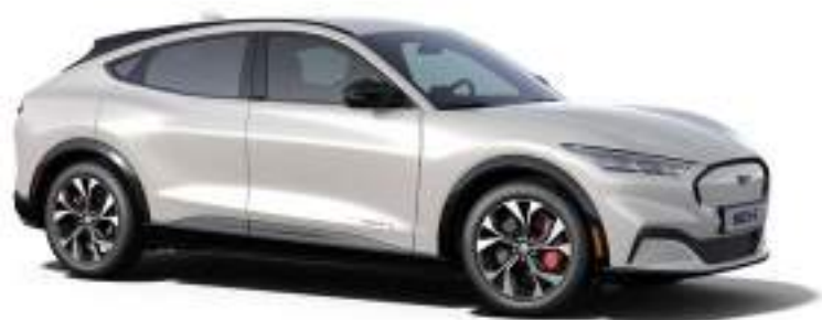
STAR WHITE - LAKIER METALIZOWANY SPECJALNY 5 000 zł