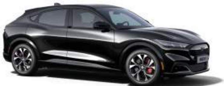
ABSOLUTE BLACK - LAKIER SPECJALNY bez dopłaty