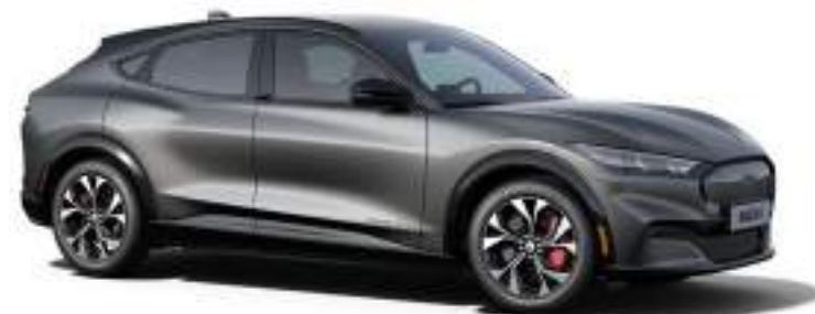
CARBONIZED GREY - LAKIER METALIZOWANY 4 200 zł