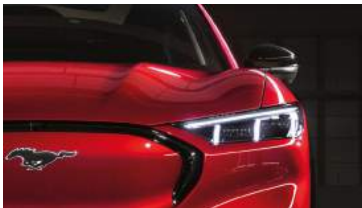
REFLEKTORY PROJEKCYJNE LED Standard dla wersji PREMIUM i GT