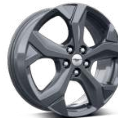
18" OBRĘCZE KÓŁ ZE STOPÓW LEKKICH Standard dla wersji MACH-E