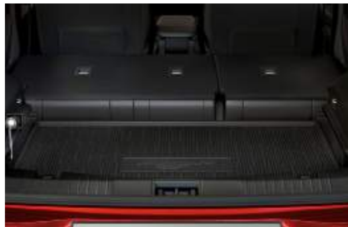
MATA GUMOWA DO BAGAŻNIKA Z LOGO MUSTANGA (2 465 296)