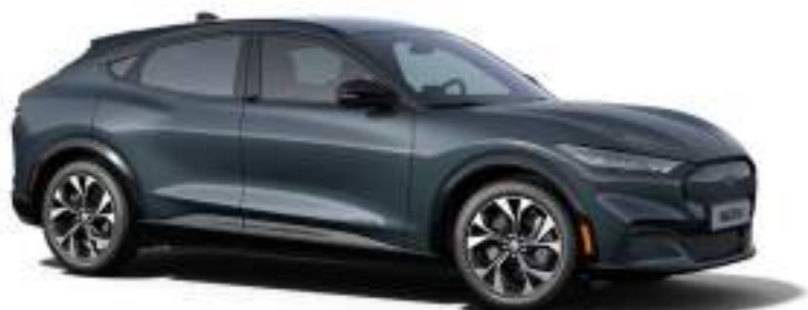
VAPOR BLUE - LAKIER METALIZOWANY 3 400 zł