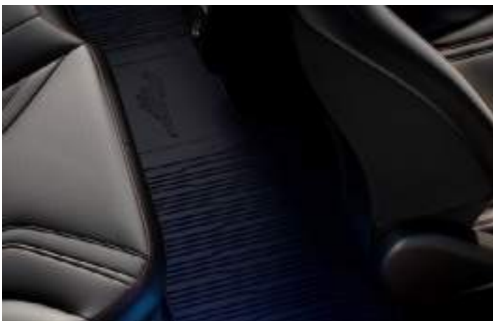
DYWANIKI PODŁOGOWE, GUMOWE - Z PRZODU I Z TYŁU (2 526 938)