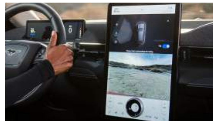
SYSTEM KAMER 360 STOPNI Standard dla wszystkich wersji