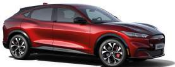
LUCID RED - LAKIER METALIZOWANY SPECJALNY 5 000 zł