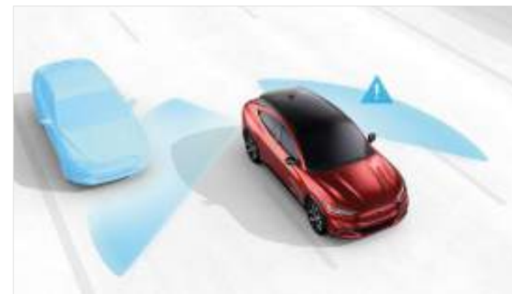
BLIND SPOT INFORMATION - system monitorowania martwego pola widzenia w lusterkach Standard dla wszystkich wersji