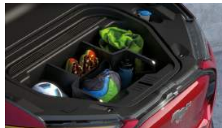
DODATKOWY BAGAŻNIK Z PRZODU POJAZDU O POJEMNOŚCI 100 LITRÓW Standard dla wszystkich wersji