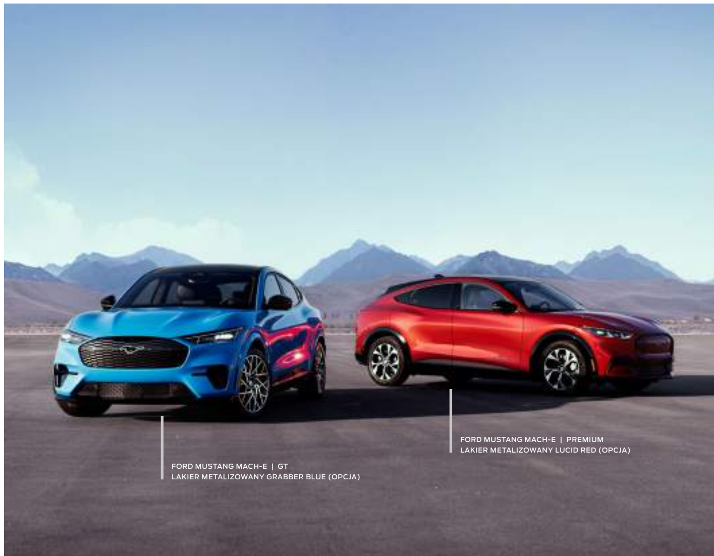
FORD MUSTANG MACH-E | GT LAKIER METALIZOWANY GRABBER BLUE (OPCJA)