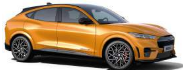
CYBER ORANGE - LAKIER METALIZOWANY SPECJALNY 5 000 zł