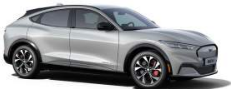
SPACE WHITE - LAKIER METALIZOWANY 3 400 zł