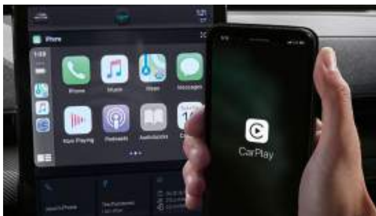
BEZPRZEWODOWA OBSŁUGA APPLE CARPLAY I ANDROID AUTO Standard dla wszystkich wersji. Wymaga kompatybilnego urządzenia.