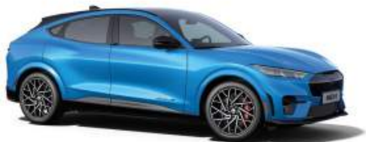
GRABBER BLUE - LAKIER METALIZOWANY 4 200 zł