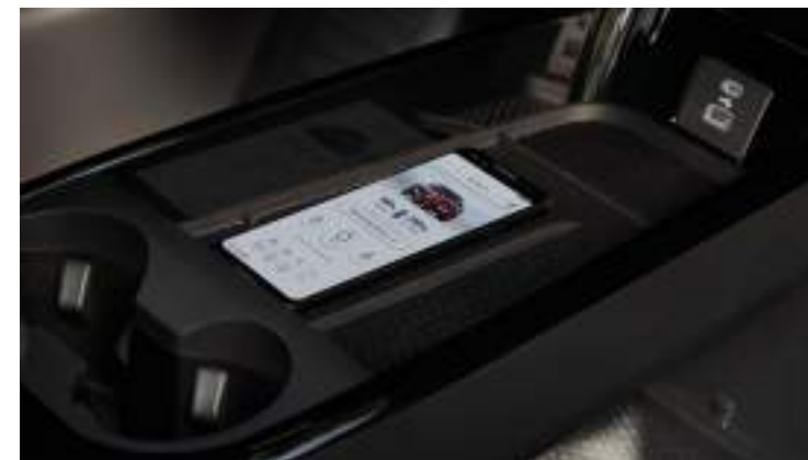
BEZPRZEWODOWA ŁADOWARKA Standard dla wszystkich wersji